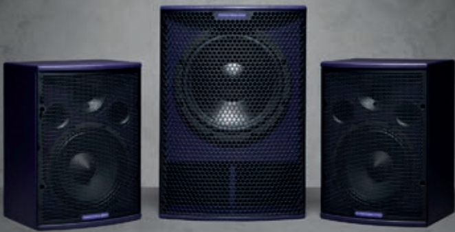
F81.2 & SB10