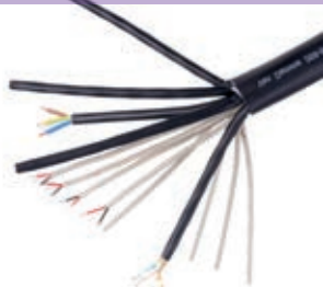
4 x Cat 6A solid F/UTP 8 x AES pair 1 x 3x2.5mm