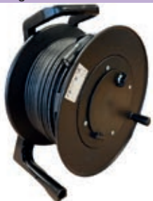
CAT-6A PUR op Schill haspel