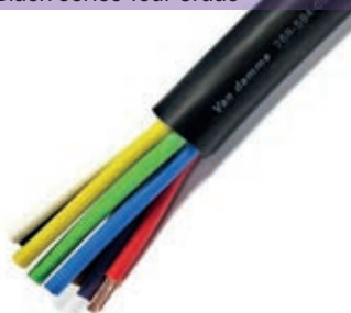
8 x 4.00mm 2 speaker