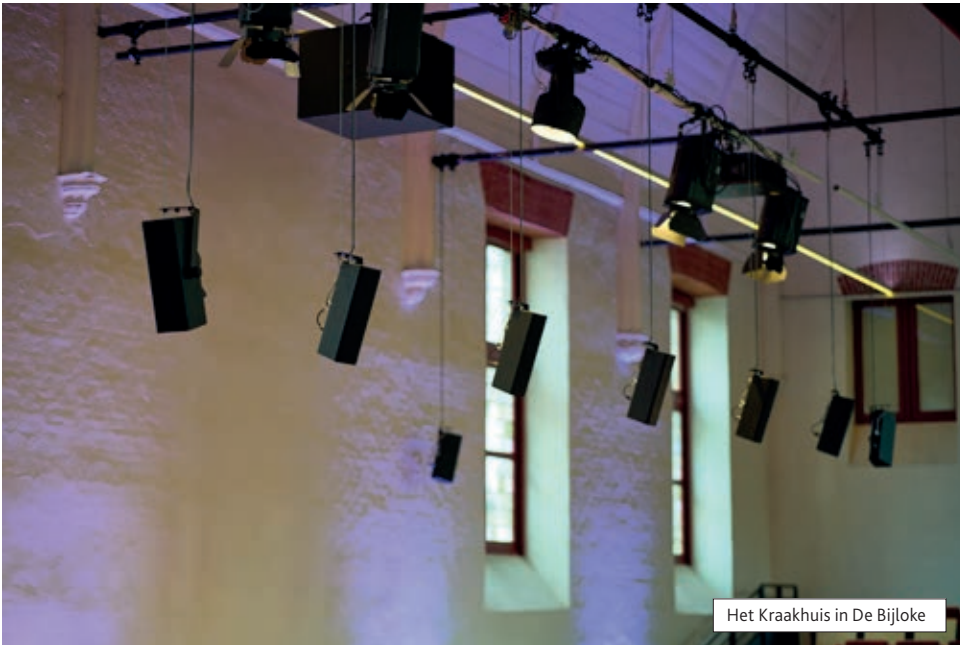
Het Kraakhuis in De Bijloke

De Bijloke (een voormalig 13e-eeuws ziekenhuis) voorzien van een gloednieuw d&b-systeem, waarna in de kleine zaal (Het Kraakhuis) een Soundscape-systeem geïntegreerd werd. En CCHA in Hasselt, waar eerder door Amptec al het allereerste Soundscape-systeem van Europa werd geïnstalleerd, heeft nu ook in de grote zaal een immersive-ready systeem. Ook het gerenommeerde Ancienne Belgique staat inmiddels al enkele jaren op de referentielijst. Naast de cultuurhuizen weten ook veel festivals de systemen van d&b te waarderen. Zo werden op Tomorrowland, Rock Werchter, Gentse Feesten en Mysteryland via Amptec systemen geleverd door verschillende productiebedrijven.