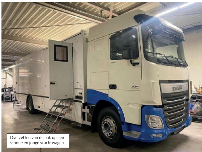
Overzetten van de bak op een schone en jonge vrachtwagen

De wagen is gebaseerd op de Blackmagic Design ATEM Constellation 8K en de Ursa Broadcast G2. “We werkten al even met Blackmagic en toen de wagen kwam waren we op