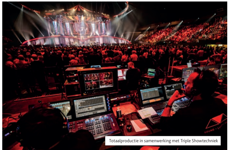
Totaalproductie in samenwerking met Triple Showtechniek