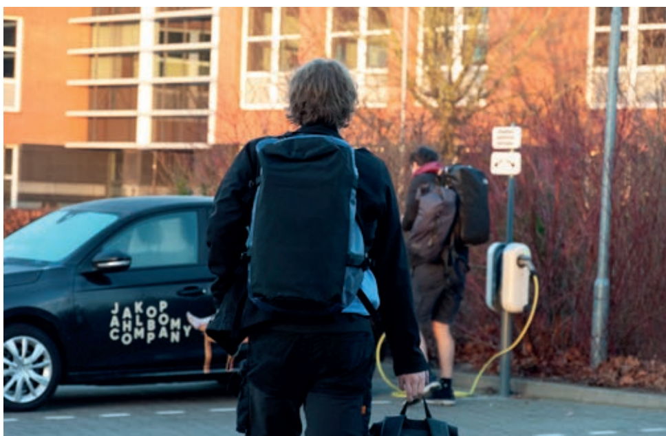
Elektrische tourauto voor de crew

aanschafwaarde terug krijgt. Die komen bovenop de bestaande voordelen van elektrisch rijden zoals de lange levensduur, minder onderhoud en goedkoper 'tanken'.