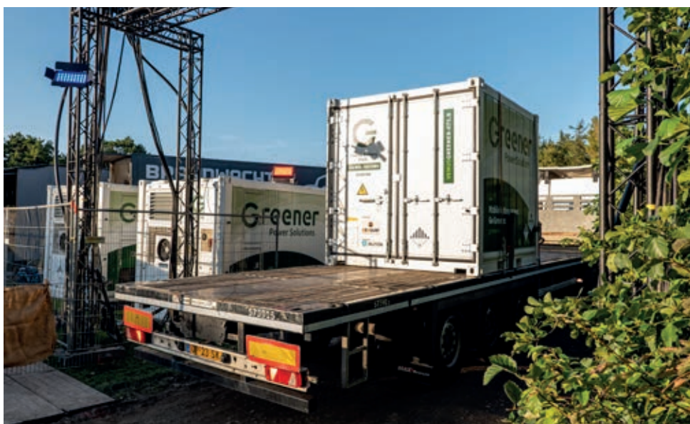
Greener batterijen - Fotograaf: Ole Zumpolle