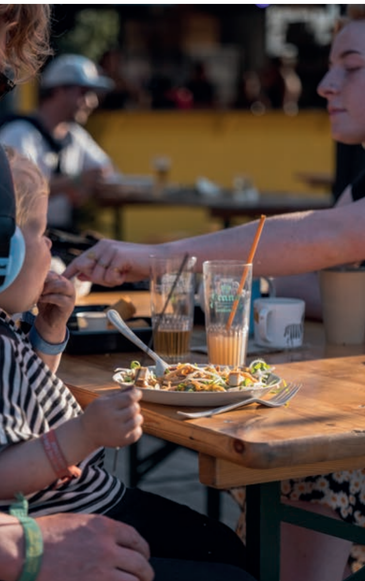
Herbruikbaar servies op ITGWO

geeft om zo'n succes te vieren. Het verzamelen van de basisdata voor een CO 2 -meting is relatief makkelijk: de productiebegroting en een technische tekening vertellen al veel, samen met bijvoorbeeld tourschema's en de energierekening. Voor gebruik binnen de eigen organisatie is er een aantal sectorspecifieke meettools. Wel moeten er branchebreed nog afspraken worden gemaakt over wat er in een meting meegenomen wordt. Tot die tijd is het lastig te zeggen hoe organisaties zich qua duurzaamheid tot elkaar verhouden. Ook kun je meer variabelen meten naast CO 2 , zoals circulariteit of land- en watergebruik. Voor een globaal inzicht in je organisatie is het meten van CO 2 al ontzettend verduidelijkend. Onderaan dit artikel staat een lijst met beschikbare meettools.