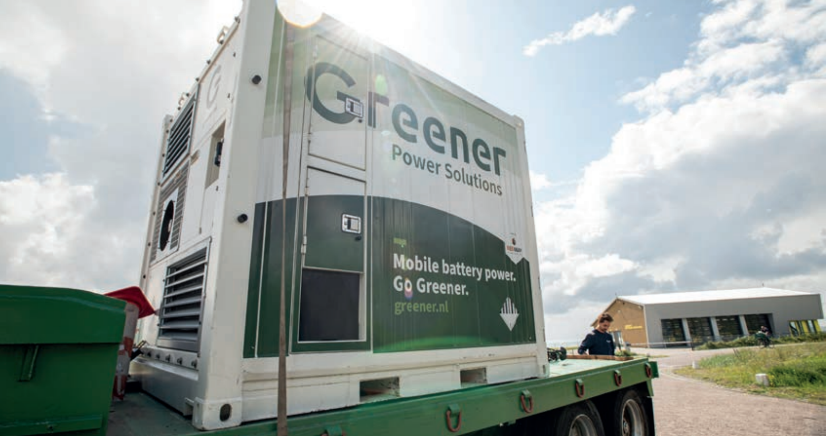
Greener batterijen