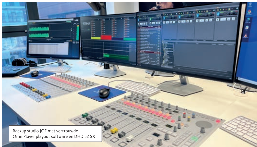
Backup studio JOE met vertrouwde OmniPlayer playout software en DHD 52 SX