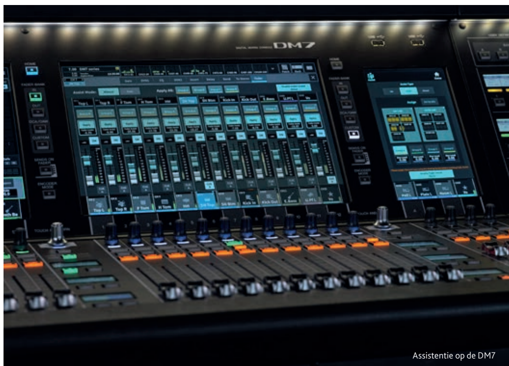
Assistentie op de DM7

De DM7-serie is een uitbreidbaar alles-in-één digitaal mengpaneel met een verscheidenheid aan in- en uitgangen en bestaat uit twee modellen. De DM7 (793 mm x 564 mm) heeft lokaal 32 analoge inputs en 16 outputs en kan 120 inputkanalen mixen, terwijl de DM7 Compact (468 mm x 564 mm) lokaal 16 analoge inputs en 16 outputs heeft en 72 inputkanalen kan mixen. Beide model-