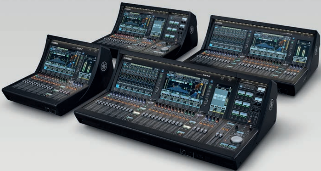
De complete DM7 familie