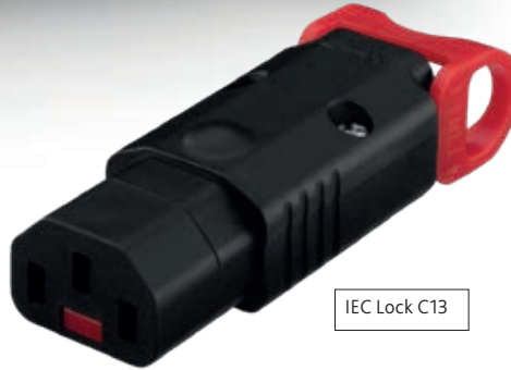
IEC Lock C13

IEC Lock+ Rewireable van Scolmore Group is 's werelds eerste vergrendelbare, rewireable C13 IEC-connector. Het is ontworpen om te voorkomen dat een reeks apparatuur per ongeluk wordt losgekoppeld, waaronder A/V-apparatuur, luidsprekers, schermen, computers en PDU's. Het is geschikt om te voorkomen dat kwetsbare apparaten in de evenementen- en entertainmentsector door trillingen worden uitgeschakeld. Het goed zichtbare vergrendelingsmechanisme wordt gecombineerd met een eenvoudig ontgrendelingsmechanisme dat ontkoppeling van alle kanten mogelijk maakt. Het vereist geen andere apparatuur of speciale ingangen om het vast te zetten, het wordt gewoon op een apparaat aangesloten zoals je met een standaard IEC-kabel zou doen. Het ontgrendelingsmechanisme met rode case markeert de connector ten opzichte van standaard IEC-kabels, zodat onderhoudspersoneel kritieke stroombronnen kan identificeren. Dankzij het slanke ontwerp kan het eenvoudig worden geïmplementeerd in gebieden waar de toegang beperkt is en het gemak van verwijdering van het grootste belang is. De IEC Lock+ C13-connector is ook verkrijgbaar in een standaard gegoten formaat.