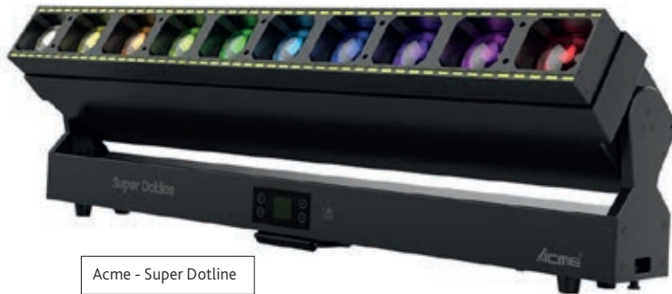
Acme - Super Dotline