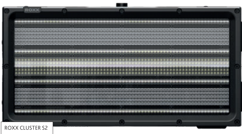
ROXX CLUSTER S2