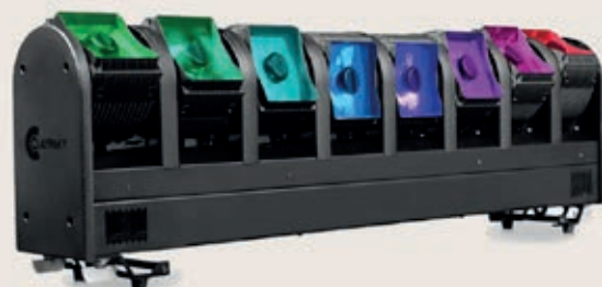
AED Group - Claypaky Volero Wave

Bij Chauvet draaide het o.a. om nieuwe toevoegingen aan de baanbrekende ➤