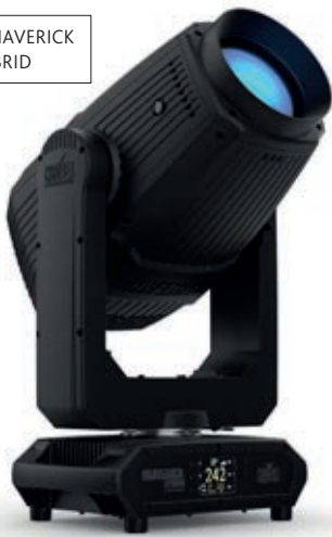
CHAUVET - MAVERICK STORM 1 HYBRID

dan de originele Sharks tegen een concurrerende prijs. De Polar Wash 740 is een andere nieuwe toevoeging aan de Showtec-portfolio die werd getoond. Het is een uiterst compacte, krachtige en lichte moving head met een hoge CRI en een gemotoriseerde zoom die vloeit in te stellen is van 3,5 tot 44 graden. De stille werking en instelbare PWM maken hem geschikt voor studio toepassingen, terwijl de IP65-classificatie betekent dat hij ook buiten kan worden gebruikt. De nieuwe V2 software voor de Showtec LAMPY geeft de bestaande LAMPY DMX-panels een flinke oppepper door toevoeging van waardevolle functies zoals MultiCell-mogelijkheden, multi-touch schermondersteuning, een nieuwe Fixture Editor, een CIE-kleurenkiezer, virtuele dimmer- en stroboscoopmogelijkheden en een nieuwe AtlaBase MultiCell-bibliotheek. Met alle nieuwe mogelijkheden is ook de nieuwe LAMPY Re-Load 4, die vier DMX-universes toevoegt aan de LAMPY V2, een handig nieuw product.