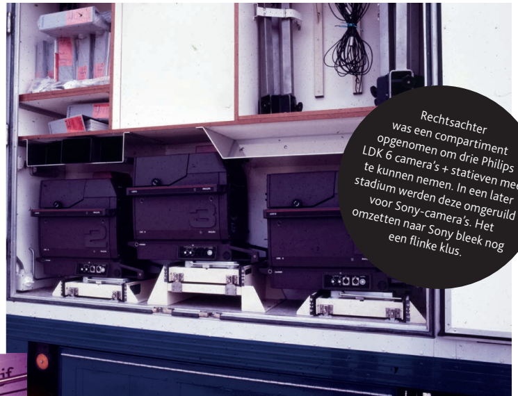
Rechtsachter was een compartiment opgenomen om drie Philips LDK 6 camera's + statieven mee te kunnen nemen. In een later stadium werden deze omgeruild voor Sony-camera's. Het omzetten naar Sony bleek nog een flinke klus.