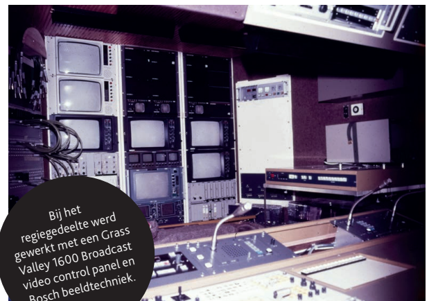
Bij het regiegedeelte werd gewerkt met een Grass Valley 1600 Broadcast video control panel en Bosch beeldtechniek.