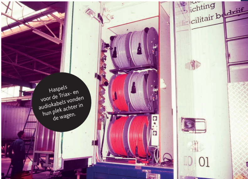
Haspels voor de Triax- en audiokabels vonden hun plek achter in de wagen.