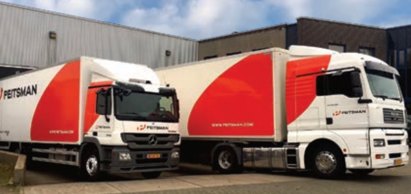
Peitsman Licht & Geluid

Peitsman is een belangrijke speler op het gebied van verhuur van geluid en licht. Het bedrijf heeft vestigingen in Rotterdam, Utrecht en Zwolle. Ze zijn alom gewaardeerd partner voor creatieve oplossingen met betrekking tot audiovisuele techniek. Het bedrijf heeft brede expertise op het gebied van concert-, evenementen- en theatertechniek. Recent schaften ze P9's , P12's en P18's aan, die inmiddels enthousiast worden ingezet op festivals, bij theaterproducties en op grote corporate events.