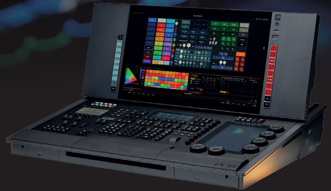
EOS Apex 5