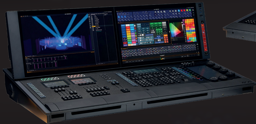
EOS Apex 10