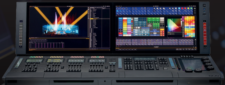
EOS Apex 20