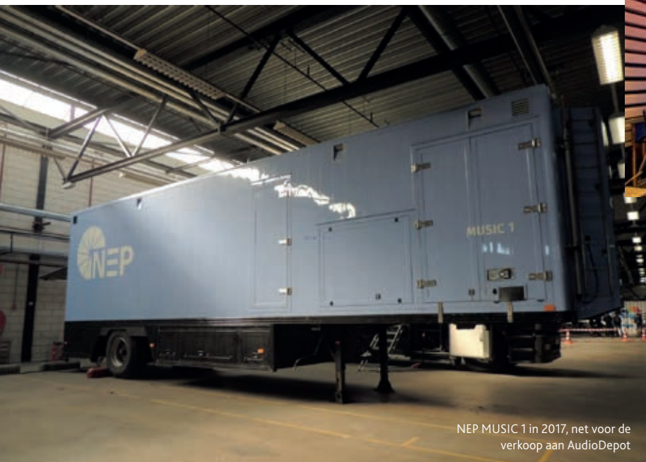
NEP MUSIC 1 in 2017, net voor de verkoop aan AudioDepot