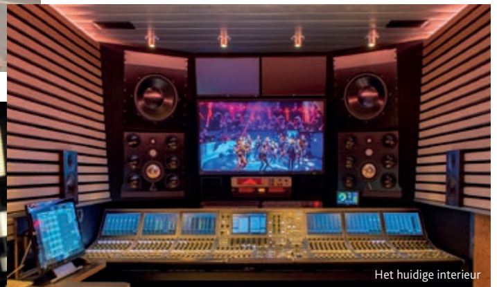
Het huidige interieur