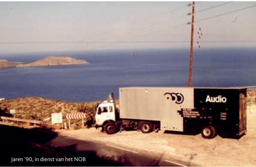
Jaren '90, in dienst van het NOB