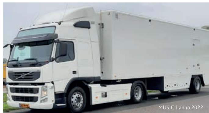
MUSIC 1 anno 2022