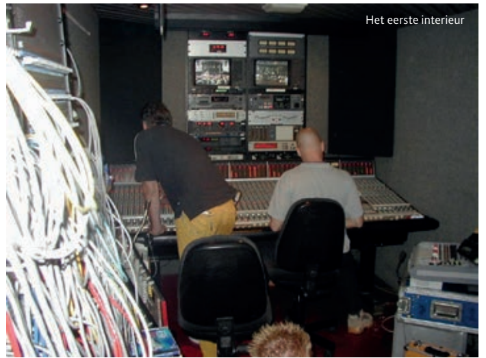
Het eerste interieur