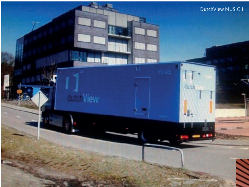
DutchView MUSIC 1